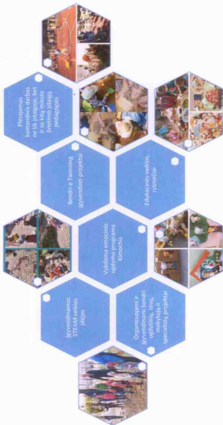
2 pav. Ugdomo(s) sąlygų pagerinimas modernizuojant ugdomo(s) aplinkas.